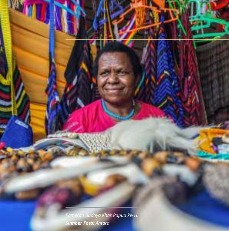
Pameran Budaya Khas Papua ke-16