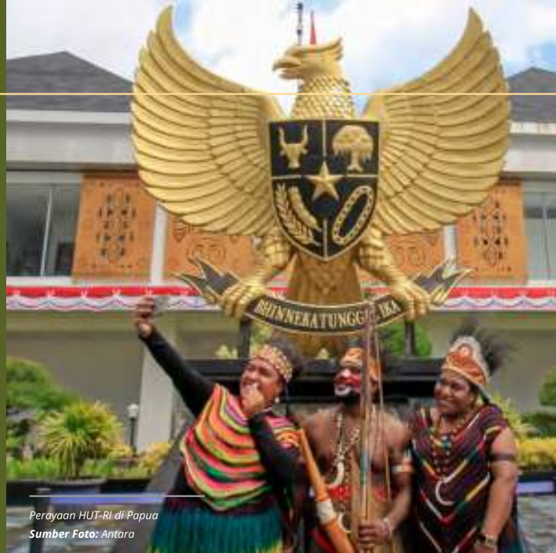
Perayaan HUT-RI di Papua