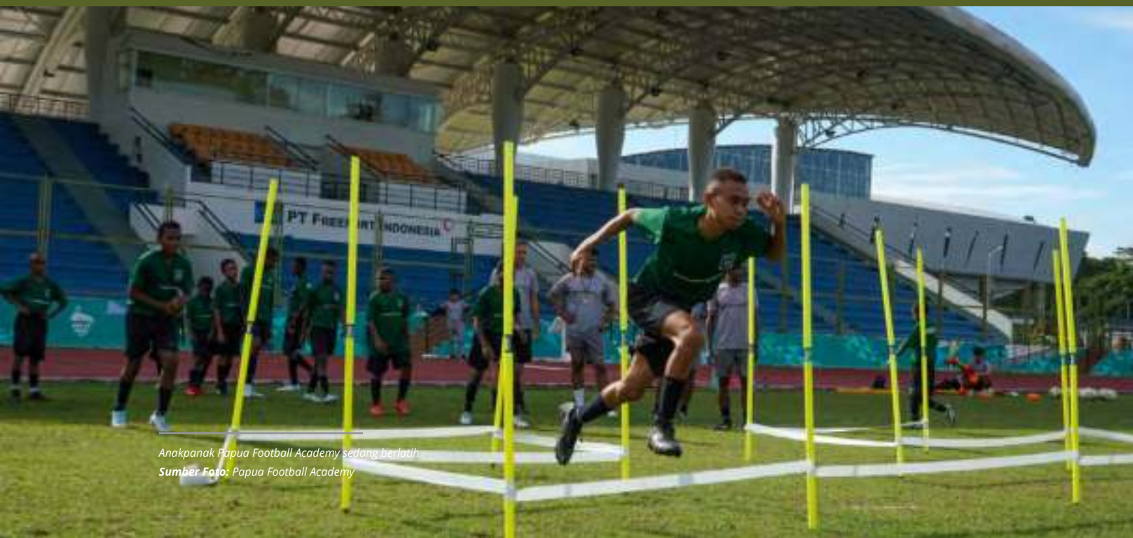
Anakpanak Papua Football Academy sedang berlatih

Pembangunan infrastruktur dari jalan, jembatan, bandara, pelabuhan, perbaikan fasilitas pelayanan kesehatan, dan pendidikan terus disebut. Juga Palapa Ring. Bahkan juga soal bagaimana menyiapkan talenta unggul di bidang olahraga.