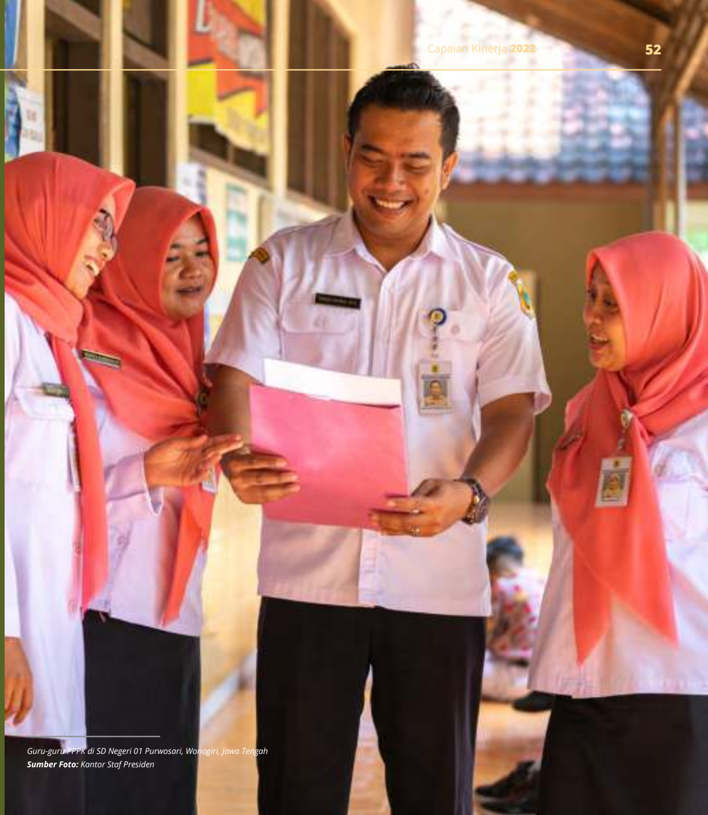
Guru-guru PPPK di SD Negeri 01 Purwosari, Wonogiri, Jawa Tengah