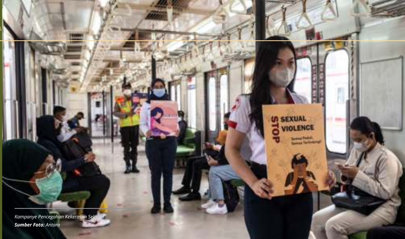
Kampanye Pencegahan Kekerasan Seksual

Beberapa jenis kekerasan seksual yang belum dijerat kini dapat ditindak dengan beleid ini. Hasil kolaborasi seluruh elemen bangsa.