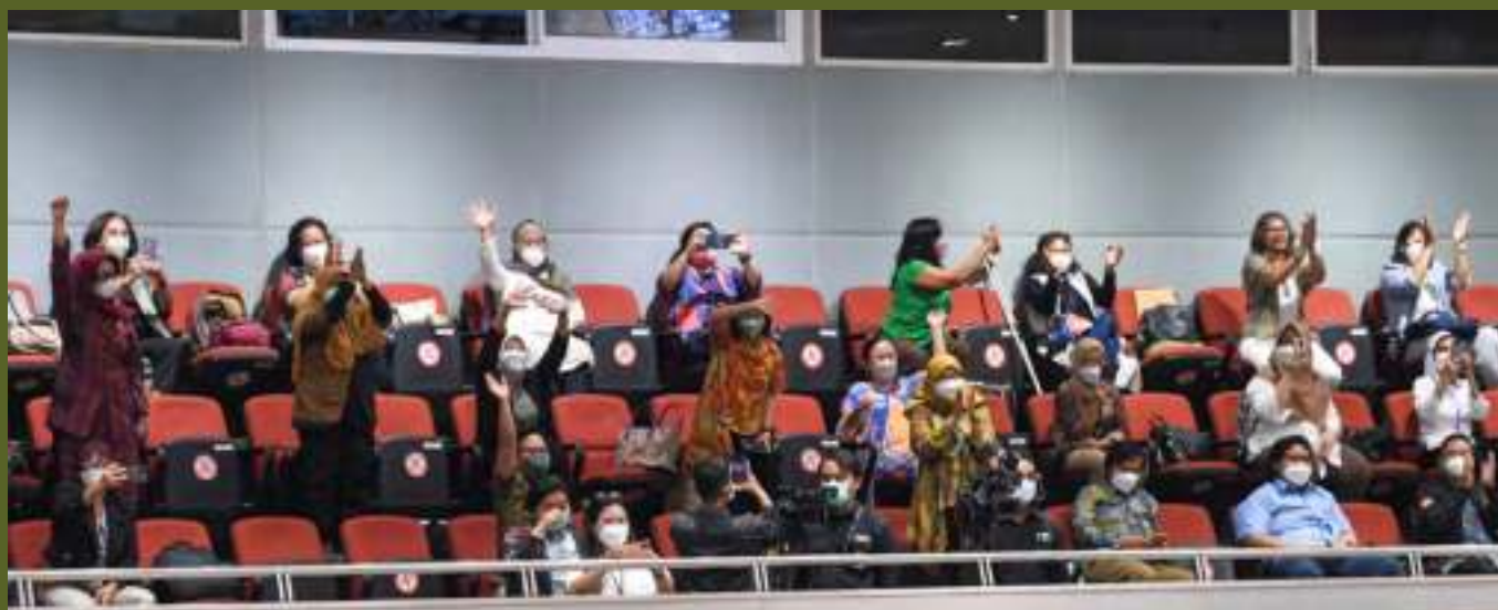
Pengunjung sidang melambaikan tangan setelah DPR RI menyatakan menyetujui pengesahan RUU TPKS menjadi UU dalam Rapat Paripurna DPR RI ke-19 Masa Persidangan IV Tahun Sidang 2021-2022 di Kompleks Parlemen, Jakarta