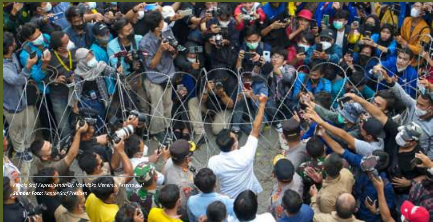
Ketala Staf Kepresidenan Dr. Moeldoko Menemui Peserta Aksi