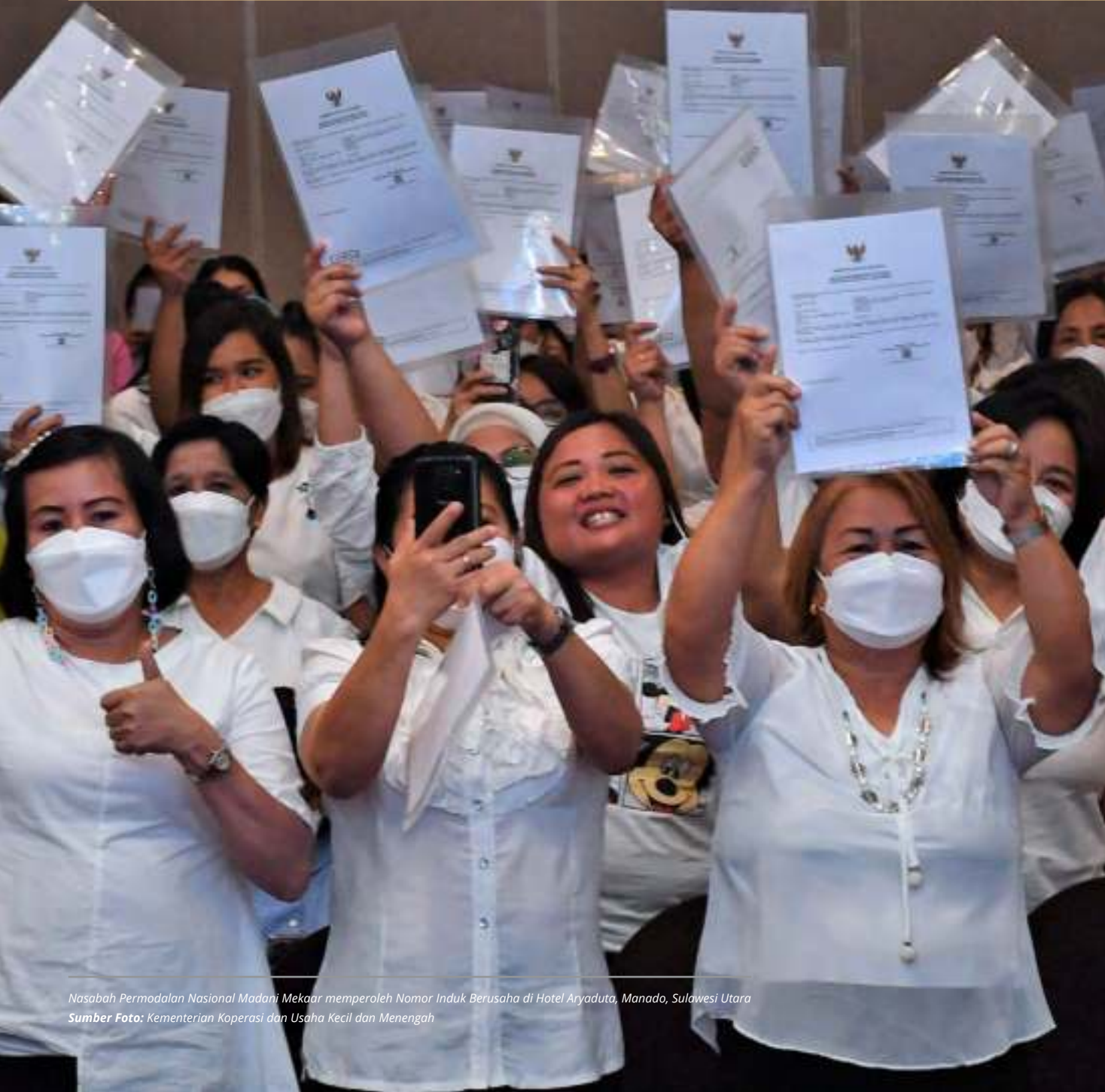
Nasabah Permodalan Nasional Madani Mekar memperoleh Nomor Induk Berusaha di Hotel Aryaduta, Manado, Sulawesi Utara