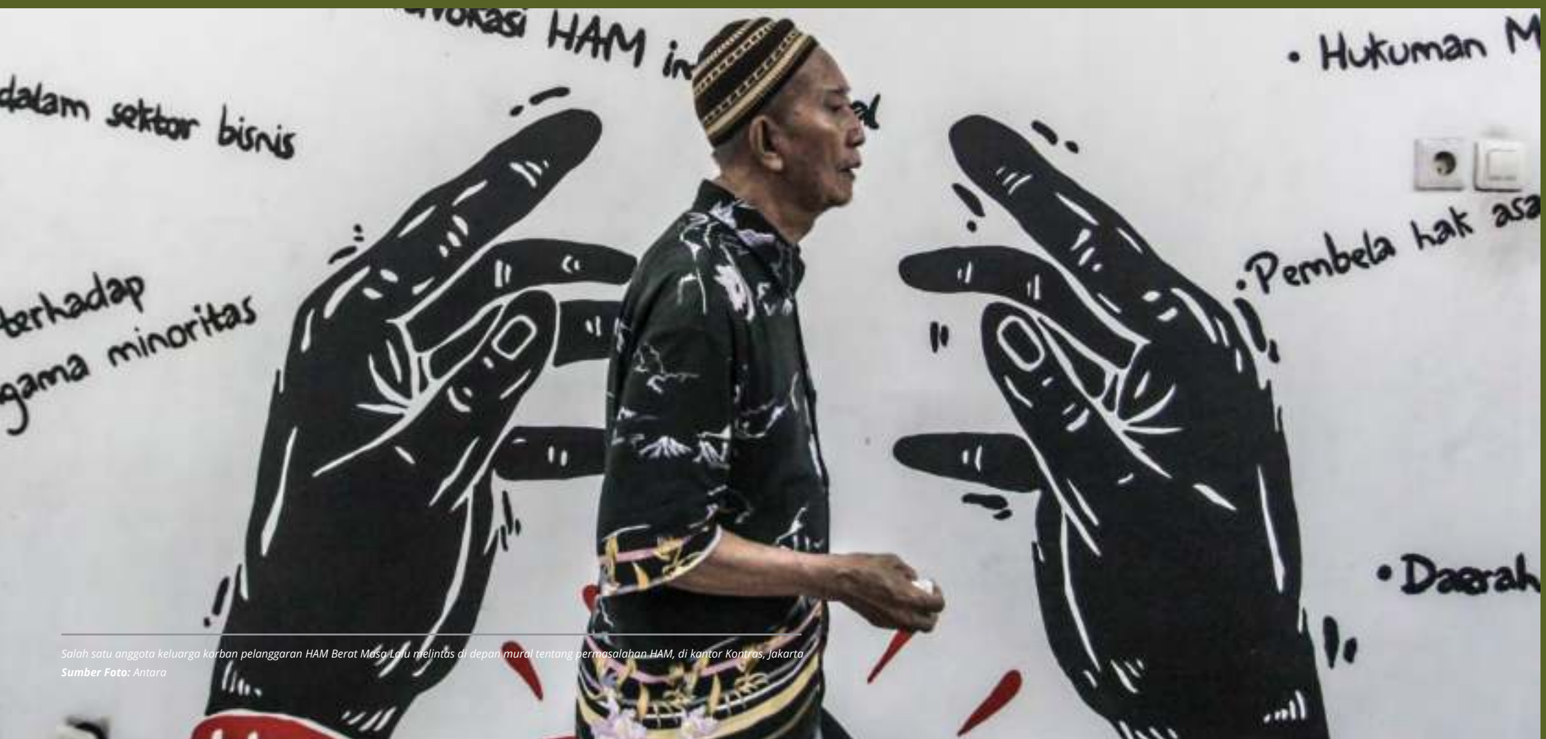
Salah satu anggota keluarga korban pelanggaran HAM Berat Masa Lalu melintas di depan mural tentang permasalahan HAM, di kantor KontraS, Jakarta

Melengkapi jalur persidangan, mekanisme non-yudisial juga dikebut. Berfokus pada hak-hak korban dan keluarga untuk didengar, diberdayakan, dimuliakan dan dipulihkan martabatnya melalui proses pengungkapan kebenaran, pemulihan, fasilitasi rekonsiliasi dan memorialisasi.