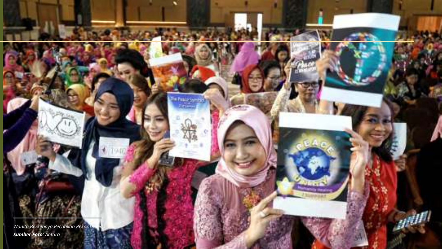
Wanita Berkebaya Pecahkan Rekor Dunia

Hukum harus ditegakkan seadil-adilnya tanpa pandang bulu. Komitmen menuntaskan pelanggaran HAM berat tetap dikebut. Indonesia bertahan agar tak terhempas pada otokrasi.