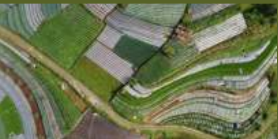
Potret Aktivitas Masyarakat Pedesaan